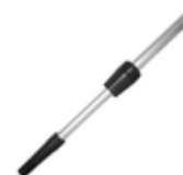
Teleskopstiel Alu ausziehbar