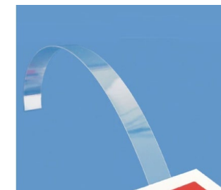
Transparentní držák na regál