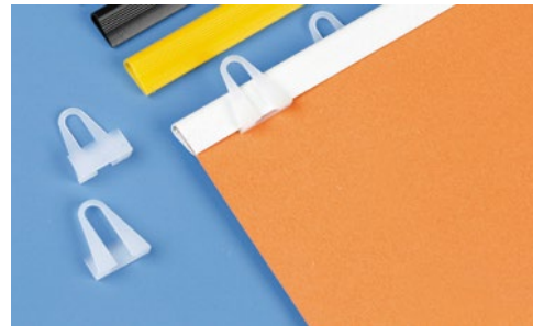
Plakátovací lišta a háčky do lišty